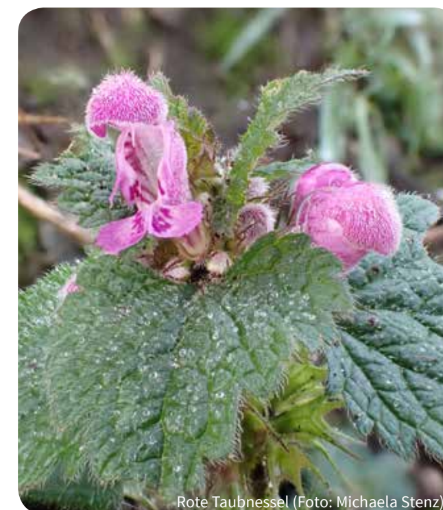
Rote Taubnessel

Außerdem gibt es eine Exkursion dazu (s.o. unter „Termine“). Mal sehen, was dabei raus kommt. Im letzten Jahr kamen immerhin fast 30 Arten zusammen!