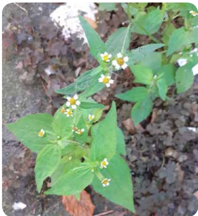
Behaartes Knopfkraut Galinsoga ciliata

Für letzteres fanden sich nach wie vor zart-saftige Vogelmiere, ein paar Triebspitzen des Knopfkrauts (das einigen vielleicht unter dem Namen Franzosenkraut geläufiger ist), junge Blätter von Spitz- und Breitwegerich, Knoblauchsrauke, Löwenzahn, Schafgarbe, Ehrenpreis und etwas Giersch und Gundermann.