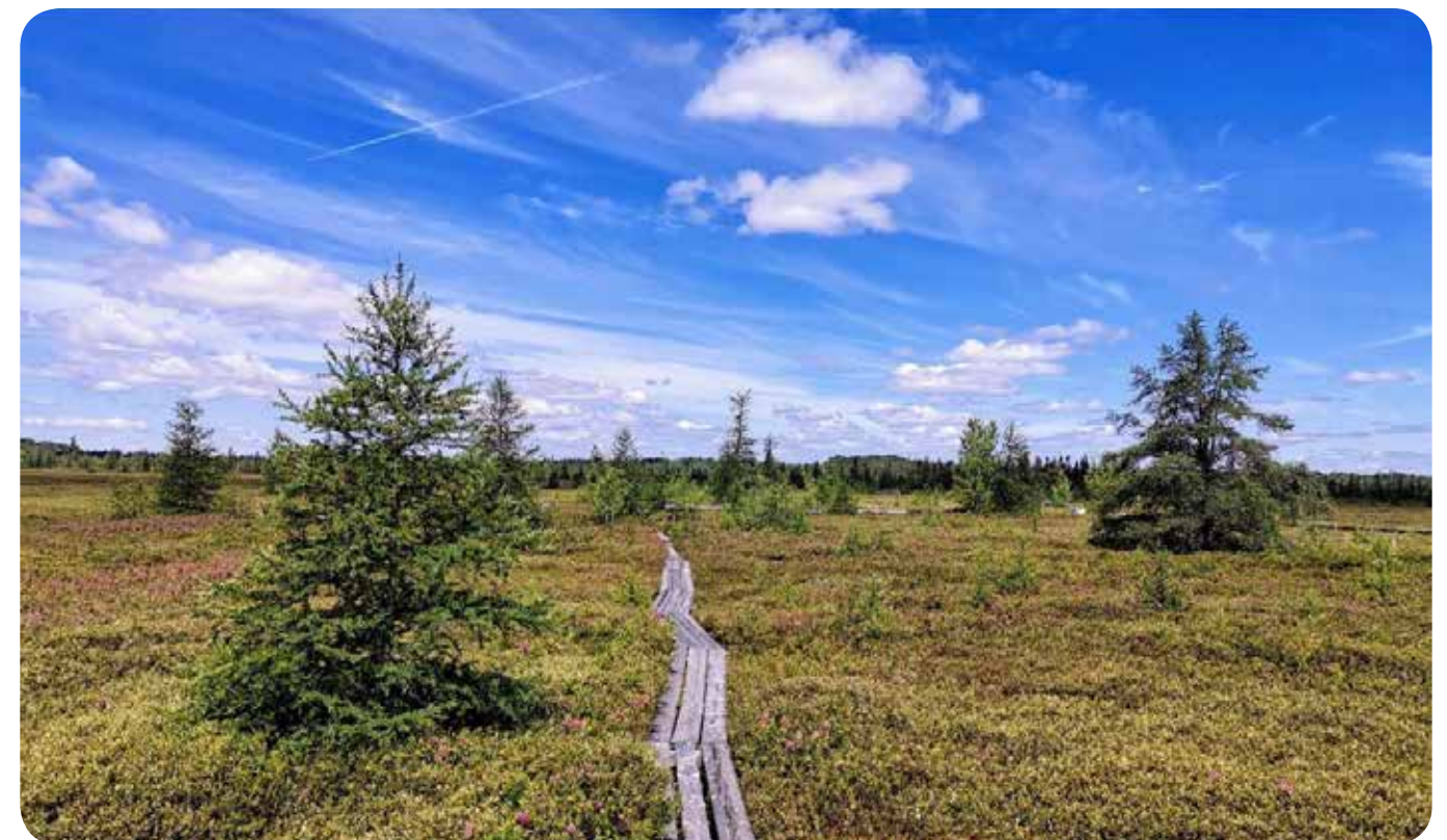
Großflächige Moore bestimmen des Landschaftsbild im Osten Kanadas