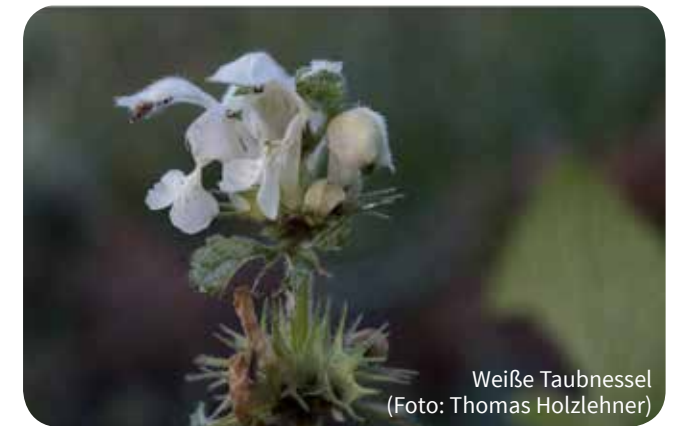
Weißer Taubnessel

Mögliche weitere Exkursionen werden kurzfristig per Mail bekannt gegeben.